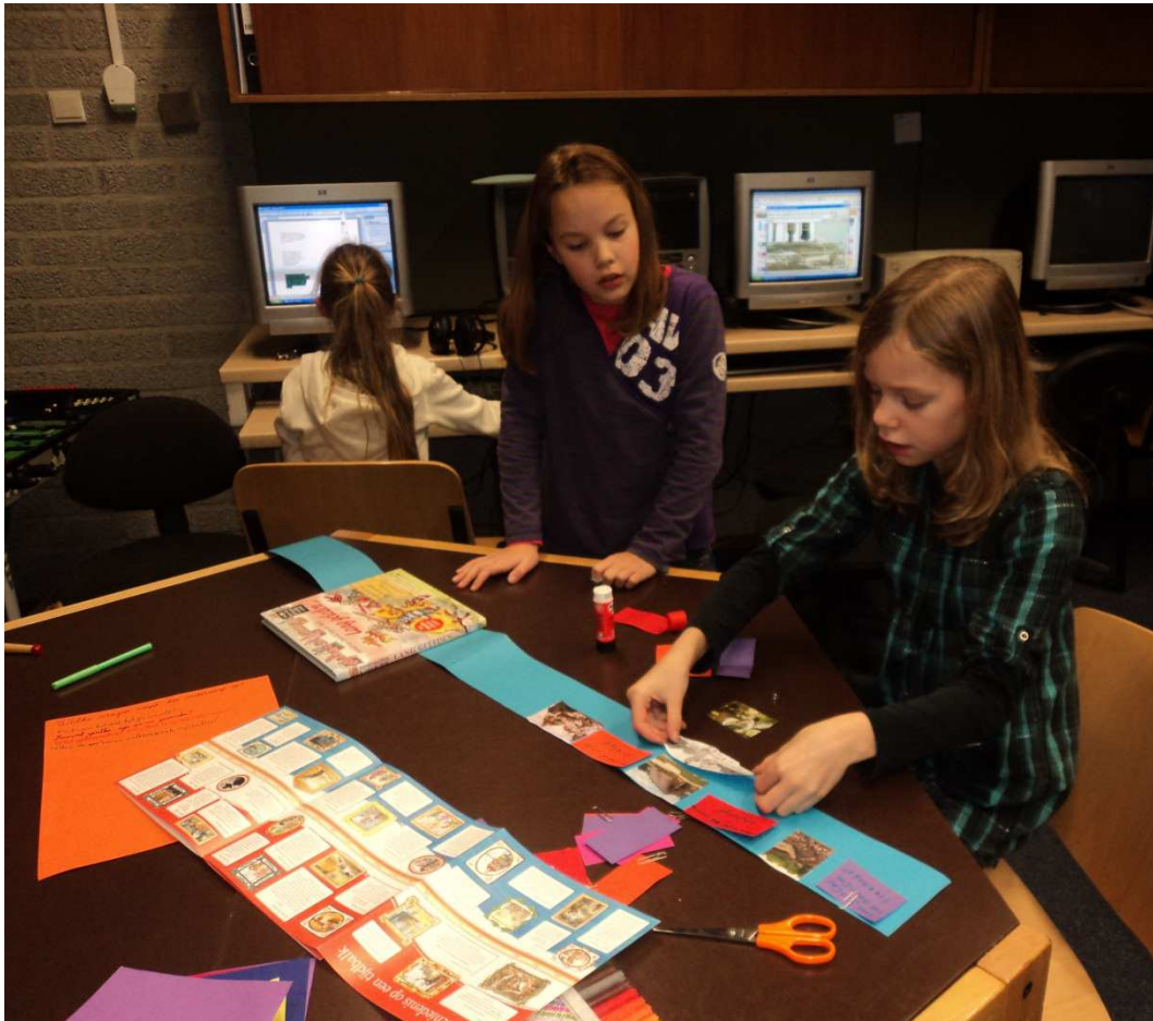
Er wordt gewerkt aan een tijdsbalk, waarbij iedereen een eigen taak heeft.