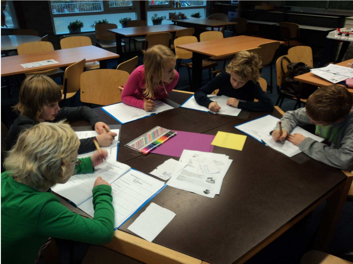
De kinderen zijn aan het werk in het logboek. Hierin houden ze bij wat ze hebben geleerd, wat er goed ging en wat er voor de volgende keer beter kan.