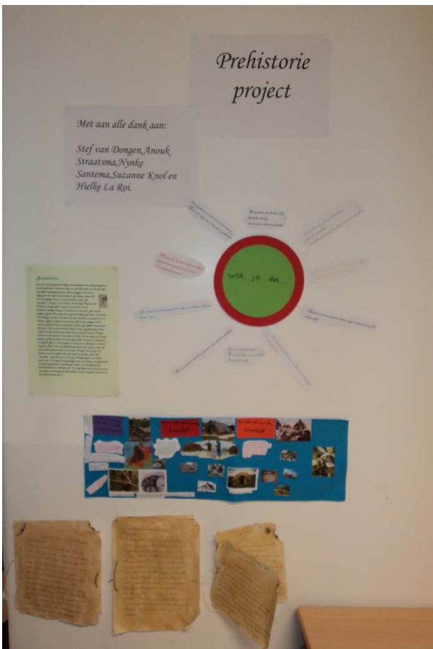
De kinderen uit groep 6 hebben verschillende dagboekverhalen geschreven. Ook is er een krantenbericht geschreven waarin belangrijke ontdekkingen door wetenschappers genoemd worden.