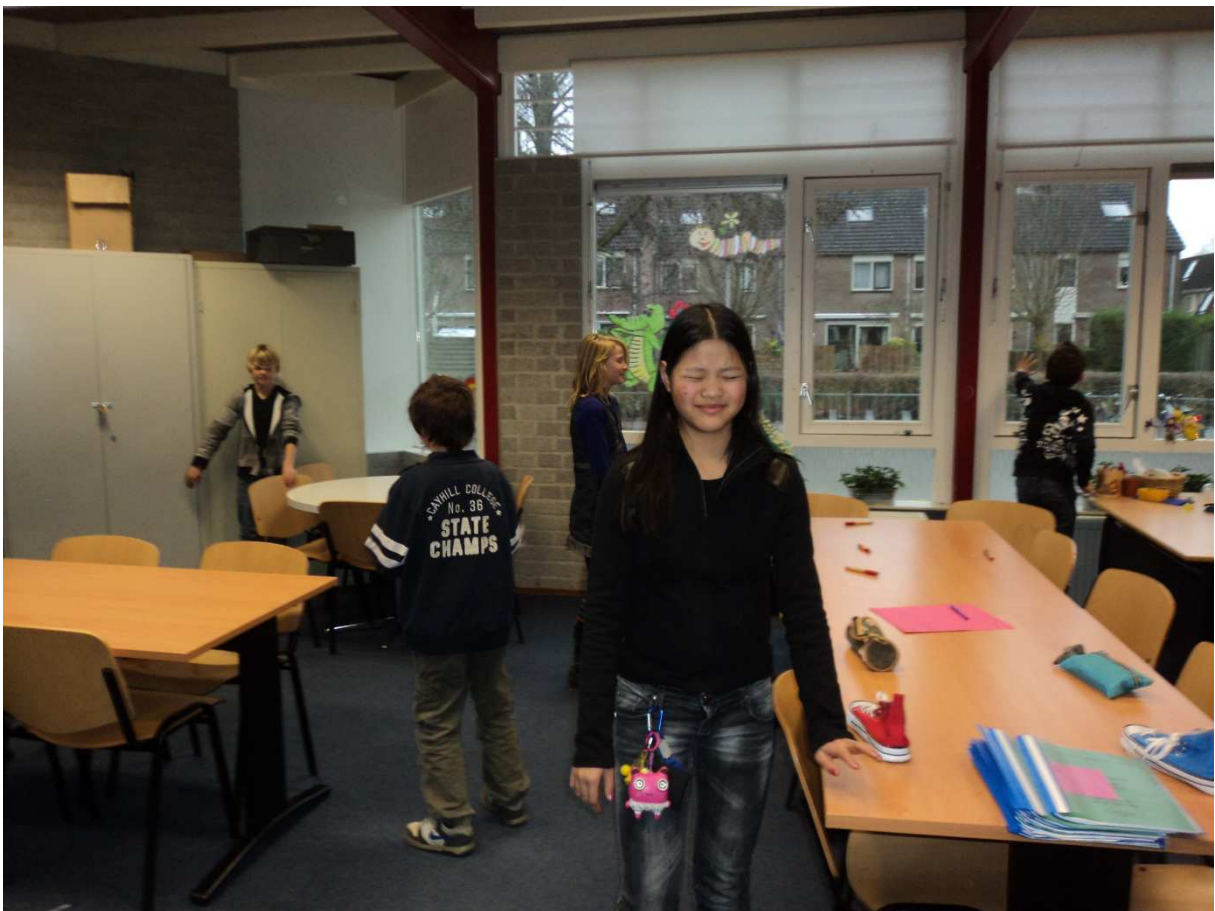
Verschillende proefjes omtrent horen en zien in groep 7-8.