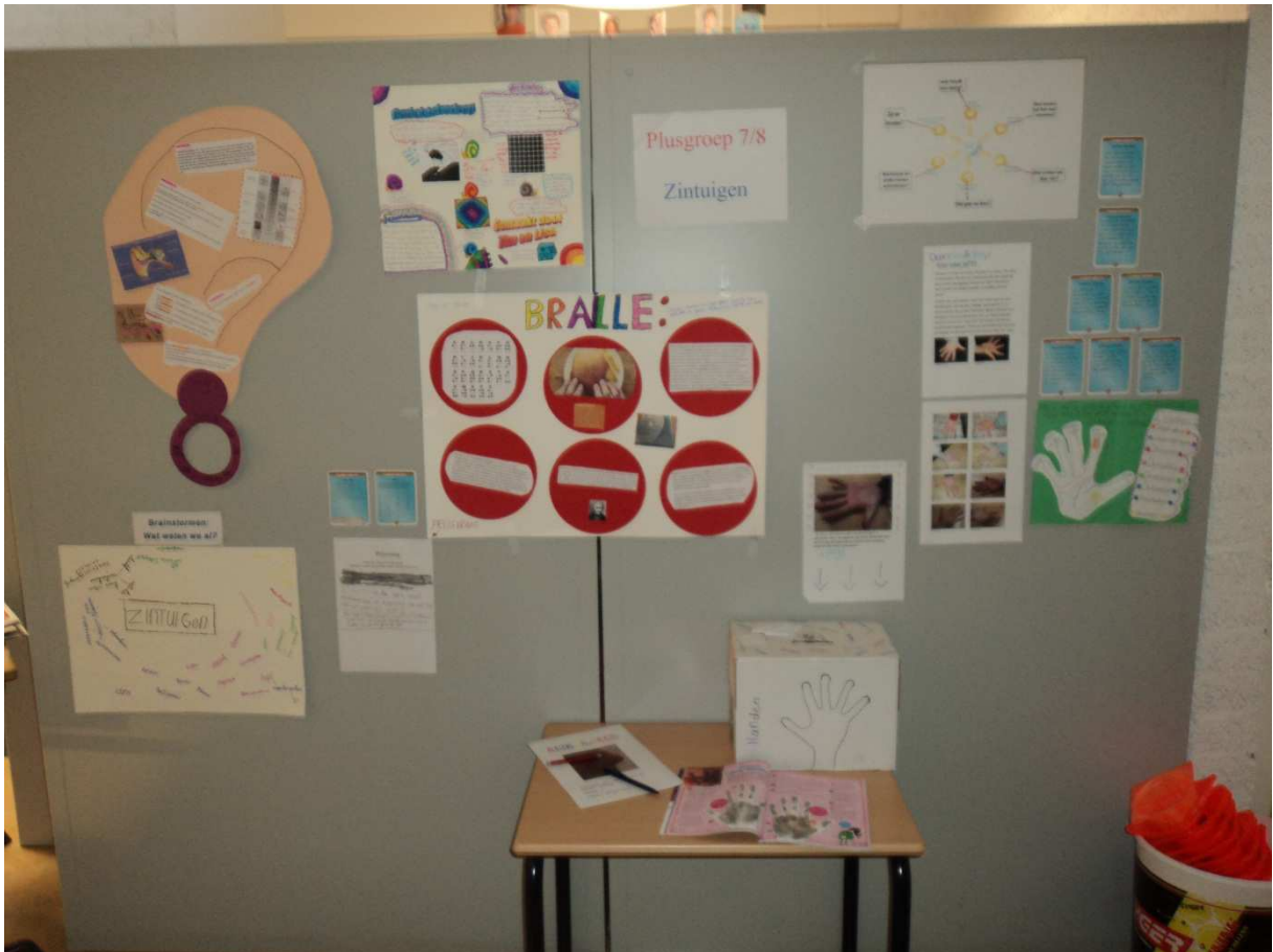
De presentatie van groep 7/8 over het thema 'zintuigen'.