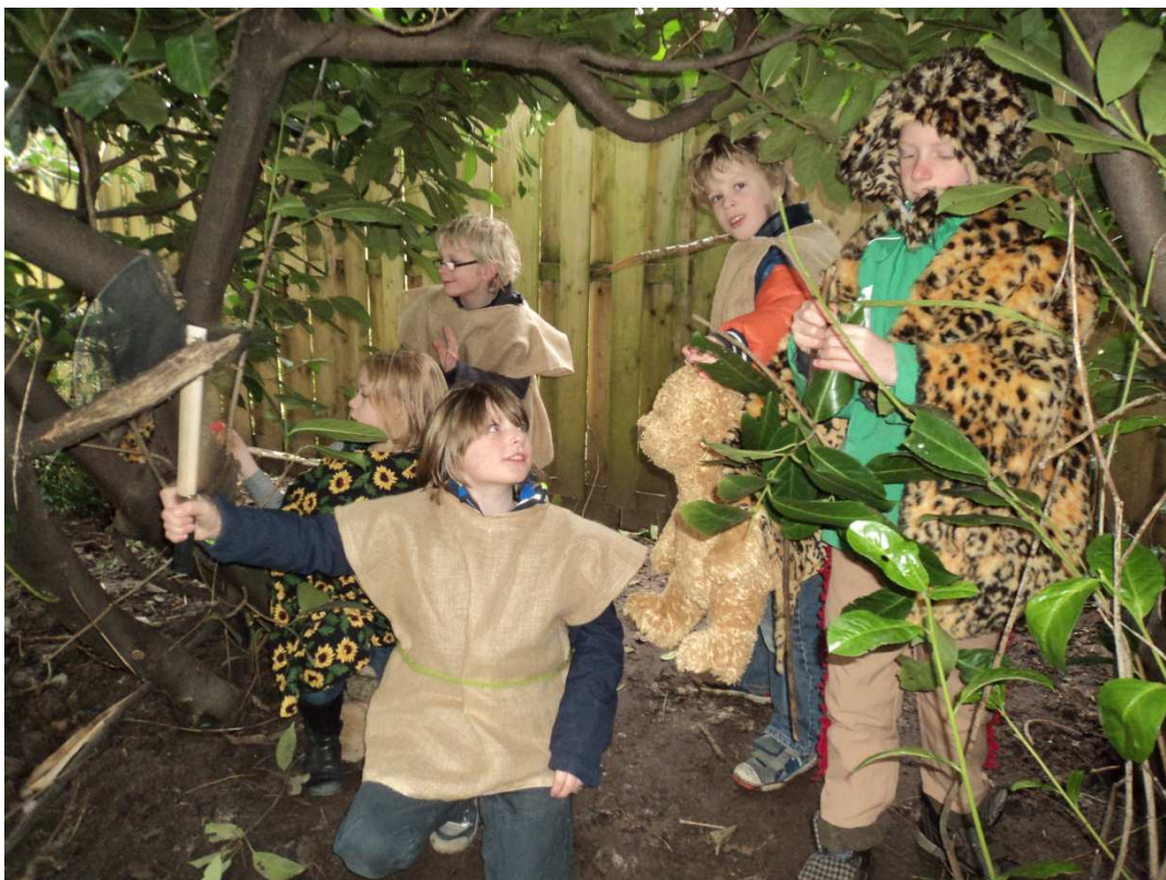
De kinderen spelen een zelfgeschreven scene na uit de prehistorie.