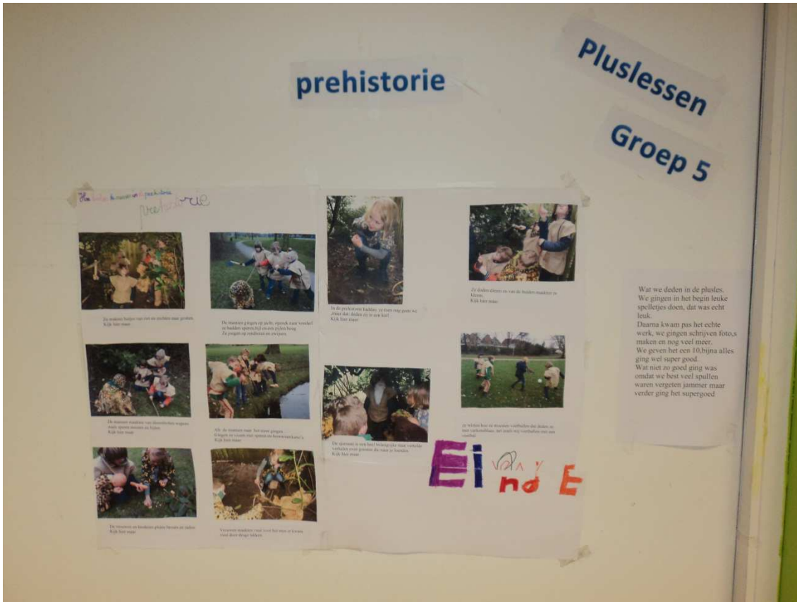
De kinderen uit groep 5 hebben een zelfgeschreven fotoverhaal gemaakt.